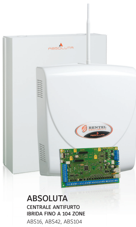
ABSOLUTA CENTRALE ANTIFURTO IBRIDA FINO A 104 ZONE ABS16, ABS42, ABS104