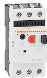
Interruttore salvamotore magnetotermico SM1P