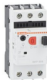
Interruttore salvamotore magnetotermico SM1P