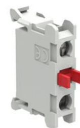
Elementi di contatto per montaggio sul fondo delle pulsantiere tipo LPZ LPXCB