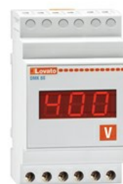
Strumenti di misura - Voltmetro DMK80 3