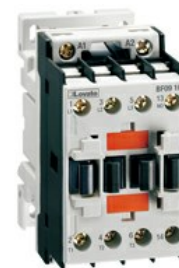
Contattore di potenza BF18