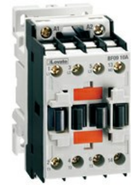
Contattore di potenza BF09