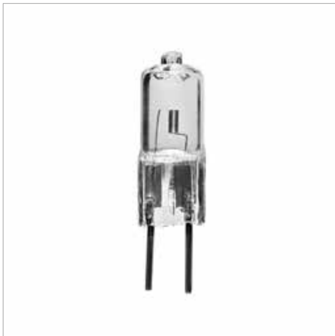
BISPINA JC - CHIARA