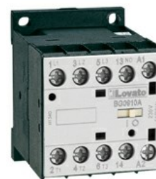
Contattore di potenza BG09