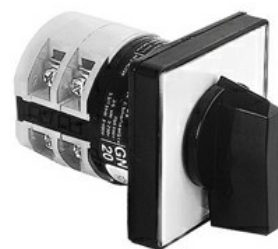
Commutatori a camme GN63