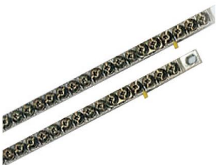
Immagine prodotto Product image