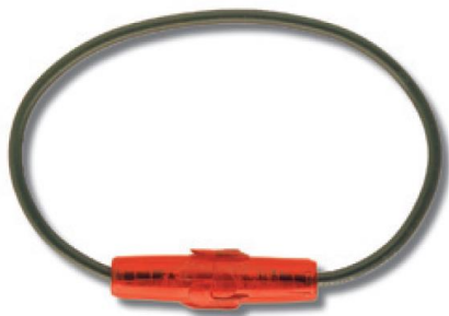
Foto e disegno (dimensioni in mm) / Product image and drawing (dimensions in mm)