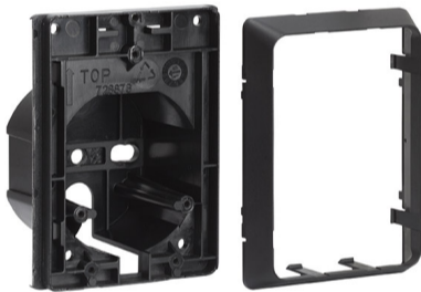
Adattatore per colonna o incasso