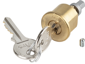
Serratura di sblocco con chiave personalizzata