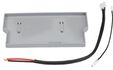
Kit supporto batteria d'emergenza (specifico per E124)