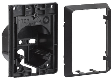
Adattatore per colonna o incasso