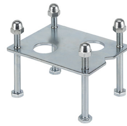
Piastra fondazione per colonna in alluminio