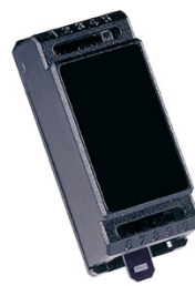
XBR2 Interfaccia BUS-Relay 2CH