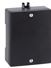
XBR4 Interfaccia BUS-Relay 4CH