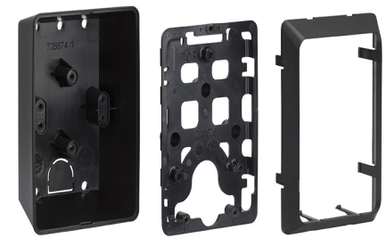
Adattatore tubo esterno