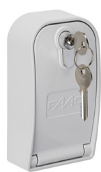
XK30 Selettore a chiave con sblocco a leva