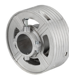
Paracadute per corona 240