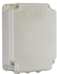
Contenitore mod. E per schede elettroniche