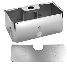
Cassetta portante INOX