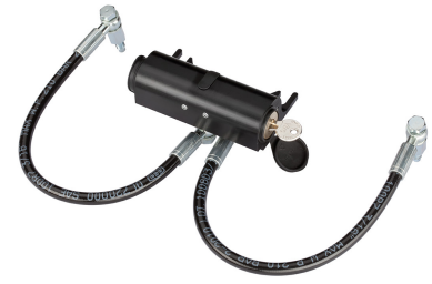
Dispositivo di sblocco idraulico (da abbinare al codice 390972) per attuatori CBAC o SBW