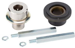
Kit giunto scanalato per attuatori CBAC o SBW