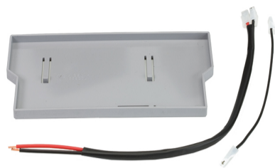
Kit supporto batteria d'emergenza (specifico per E124)