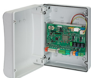
Apparecchiatura elettronica E124 con contenitore