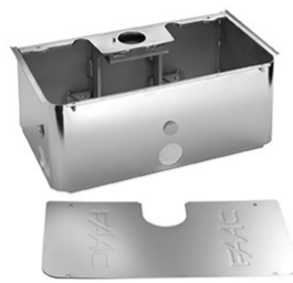
Cassetta portante INOX