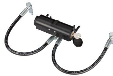
Dispositivo di sblocco idraulico (da abbinare al codice 390972) per attuatori CBAC o SBW