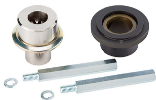
Kit giunto scanalato per attuatori CBAC o SBW