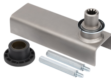
Kit scarpetta S800 saldata (saldatura conforme a UNI EN ISO 15614-1)