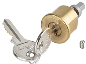
Serratura di sblocco con chiave personalizzata